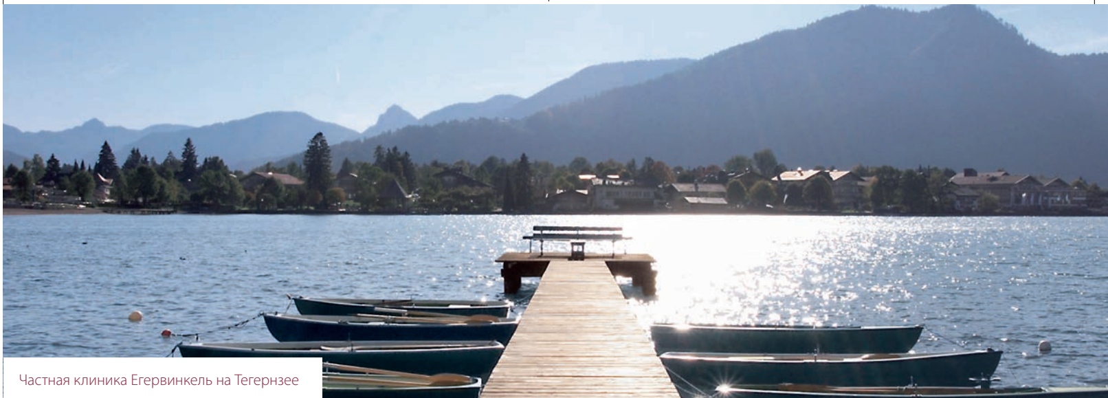
Частная клиника Егервинкель на Тегернзее