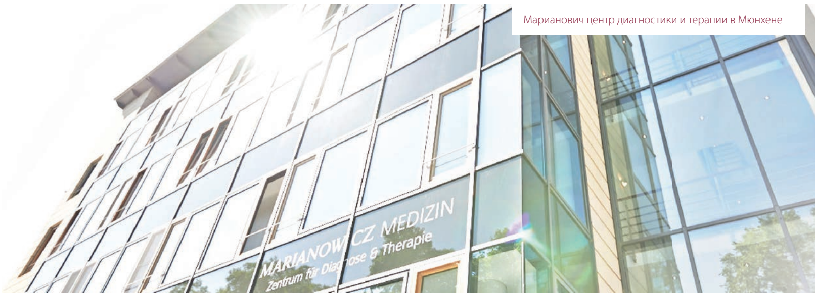
Марианович центр диагностики и терапии в Мюнхене