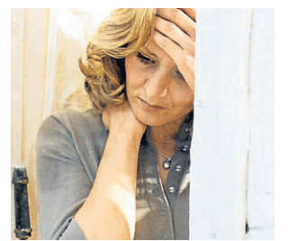
Viele werden mit der Diagnose Krebs schwer fertig.

Angst, Wut, Verzweiflung: Nach der Diagnose Krebs kämpfen viele mit Gefühlen, die sich alleine nur schwer bewältigen lassen. Untersuchungen haben gezeigt, dass fast ein Drittel der Erkrankten es nicht aus eigener Kraft aus dieser Krise schafft. Oft fallen sie nach der strapazierten Therapie in ein tiefes Loch, ziehen sich zurück oder fühlen sich völlig überfordert. Im schlimmsten Fall folgen psychische Störungen und Depressionen.